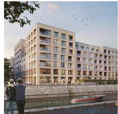
Wiener Etagen Berlin-Moabit (Europacity)