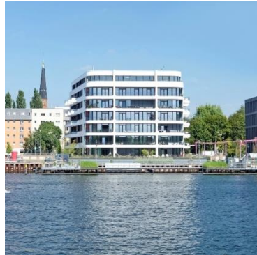
The White Berlin-Friedrichshain