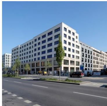
Prager Karree Berlin-Moabit (Europacity)