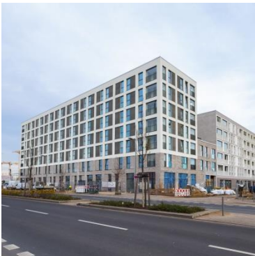
Budapester Höfe Berlin-Moabit (Europacity)