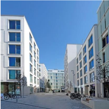
Puhmannshof Berlin-Prenzlauer Berg